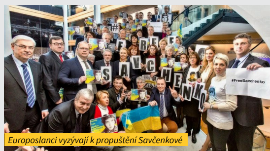
Europoslanci vyzývají k propuštění Savčenkové

nami i národnostmi jsem se obrátila na místopředsedkyni Evropské komise Federicu Mogheriniovou s výzvou, aby Evropská Unie iniciovala sankce proti osobám, které se podílely na únosu Ukrajinky, jejím uvěznění a obvinění, včetně soudního procesu. ◀